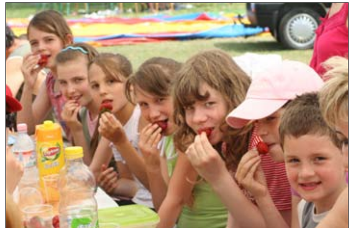
A családi napon az osztályok külön ették meg a finom ebédet. Akadt olyan osztály, akik még szamócát is kaptak ebéd után.