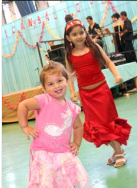
A legkisebbek is táncra perdültek.