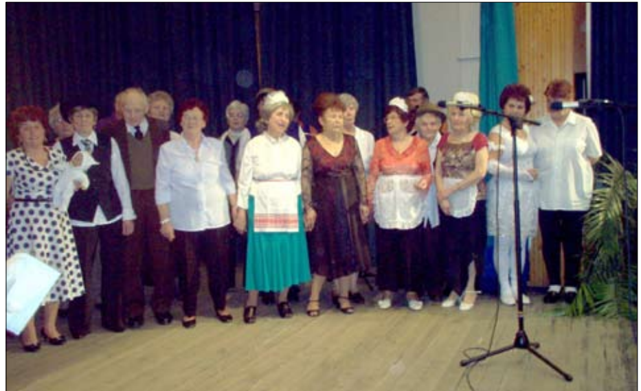
A résztvevők egy csoportja.

Február 19-én tartottuk a farsangi ünnepségünket. Mindannyiunk szórakoztatására több ötletgazdag klubtagunk jelmezbe öltözött. Volt ott tuskóhúzó öreglány, szigorú katonaparancsnok, indiai szépség, görög hölgy, kártyavevő cigányasszony, hajléktalan, földönjáró angyal, melyet követett az ördög – utódjával, a kisördöggel. Nagy derűtséget okozott a bevonuló nyugdíjas hölgyek sorozása, valamint Lagzi Lajcsi a trombitájával. Felleptek „világhírű” balett-táncosok, a magyar kártya ászai (tél, nyár, ősz, tavasz), és a hőember sem akart még elolvadni. Jól mulattunk Macsek és Hajó tréfás jelenetén, a féltékeny vőlegény és púpos menyasszonya kettősén. A múlt évben bemutatott