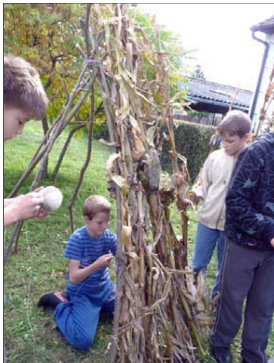
Az 5. osztályosok menedéket építenek